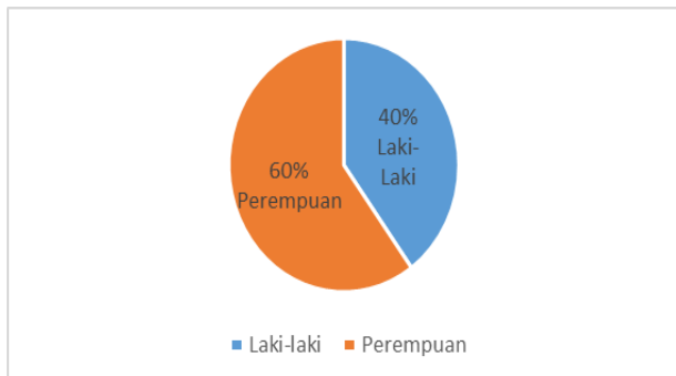
Gambar 1 Karakteristik Petugas Pendaftaran Pasien BPJS Rawat Jalan di Rumah Sakit Harum Sisma Medika Berdasarkan Jenis Kelamin

Berdasarkan hasil dari tabel 3 rata-rata usia petugas pendaftaran pasien adalah 27 tahun dengan standar deviasi 5 tahun. Dan usia terendah petugas pendaftaran adalah 22 tahun sedangkan usia tertinggi petugas pendaftaran adalah 40 tahun.